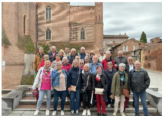
Voyage à ALBI