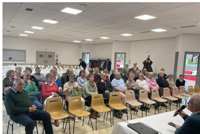
Assemblée Générale 2025 à Eglise-Neuve-de-Vergt